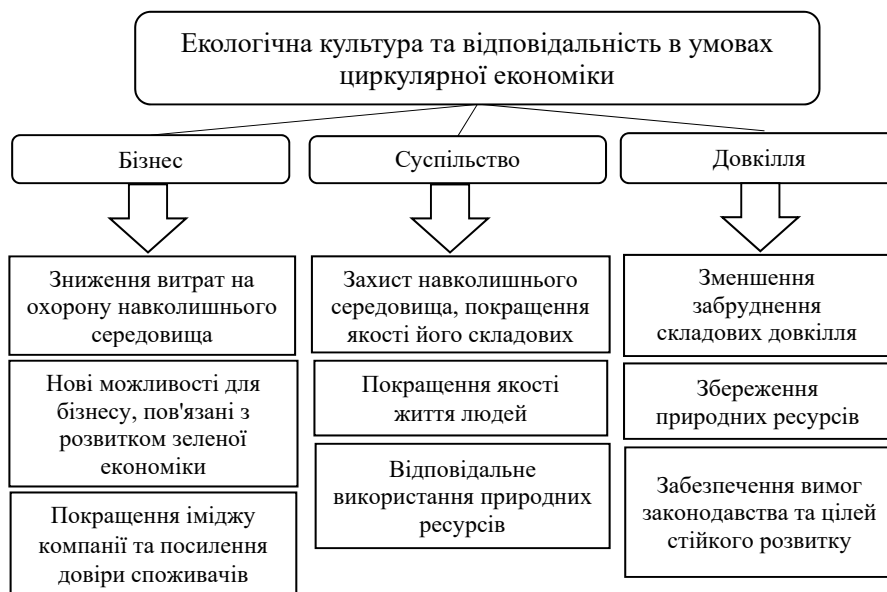
Рис. 2. Основні переваги впровадження екологічної культури та відповідальності в умовах циркулярної економіки

Ці дані свідчать про зростаючу тенденцію усвідомлення та інтеграції стійкого розвитку в українському бізнесі, а також про збільшення кількості компаній, які публікують звіти у цій сфері.