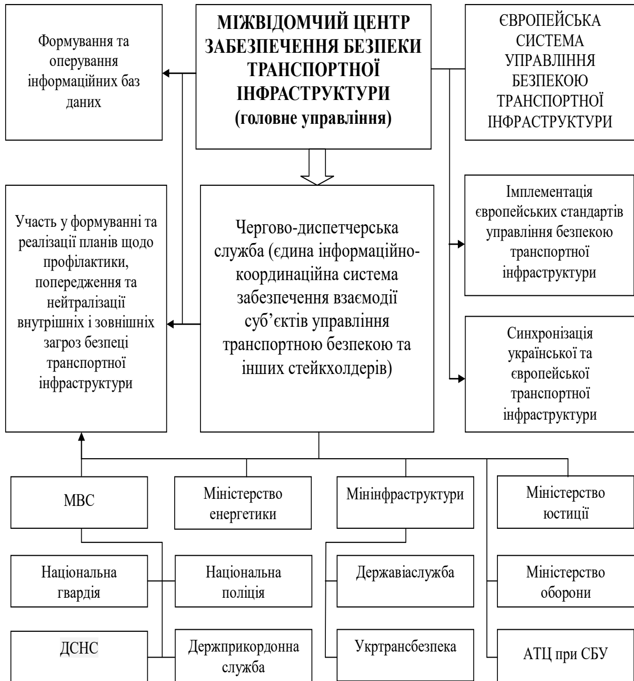
Рис. 1. Організаційно-координаційний механізм державного управління безпекою транспортної інфраструктури

Обґрунтовано, що реалізація такої мети може бути досягнена шляхом формування інституційного механізму реалізації державного управління безпекою транспортної інфраструктури з урахуванням інноваційного забезпечення його розвитку. У зв'язку з цим запропоновано створення інноваційного кластера в системі державного управління безпекою транспортної інфраструктури (рис.2).