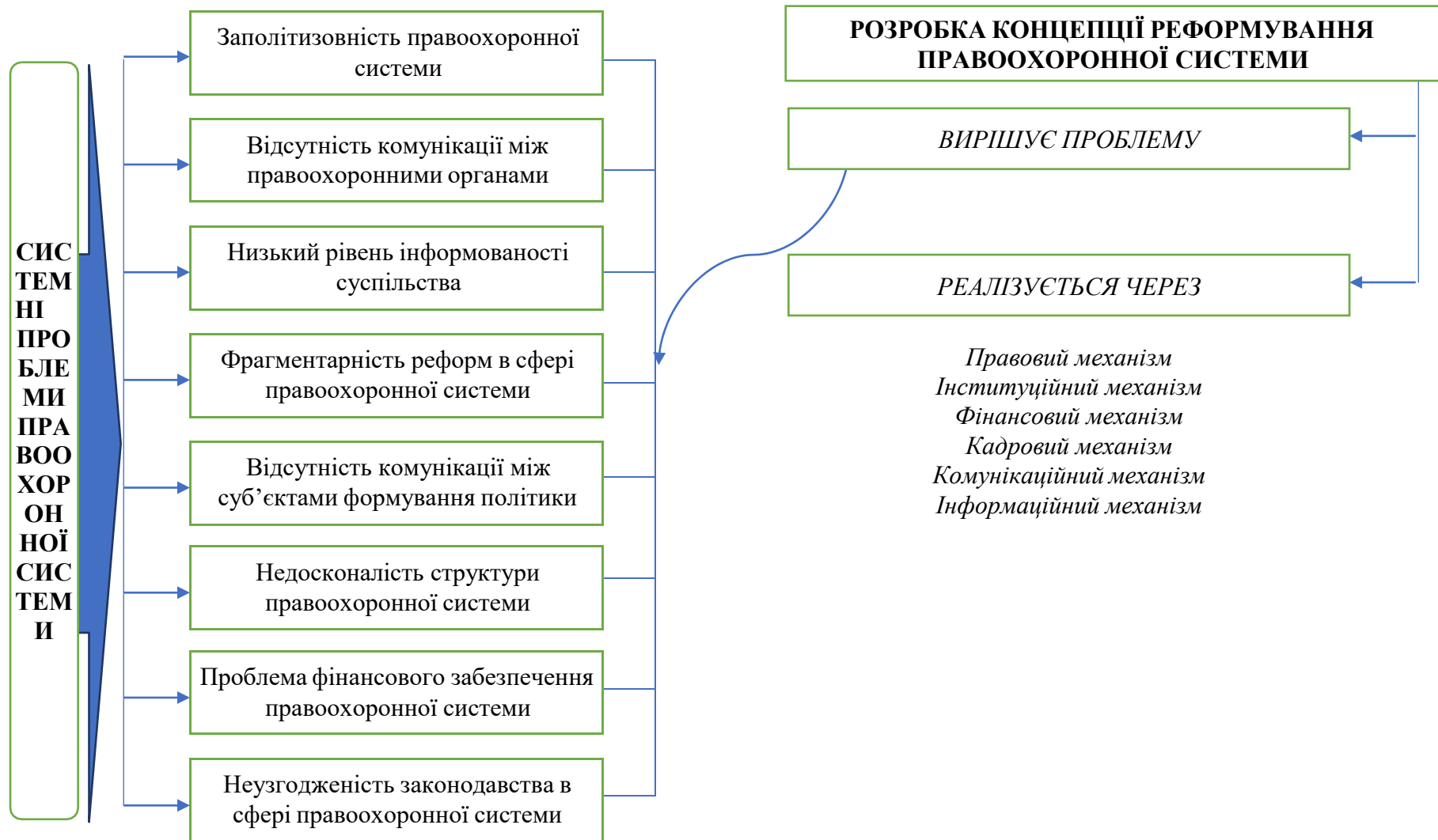
Рис. 1. Системні проблеми державної політики в сфері трансформації правоохоронної системи та напрями їх вирішення