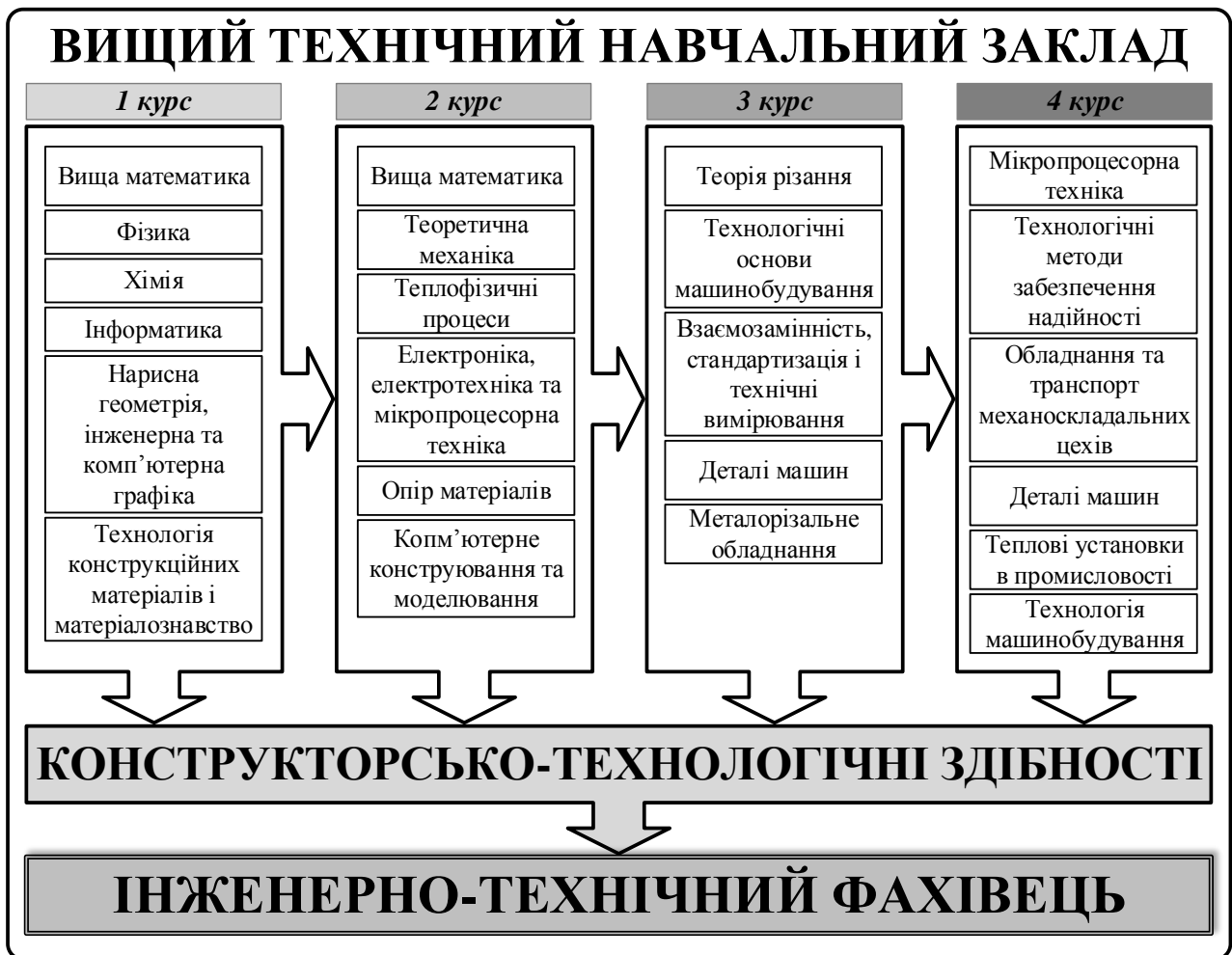
Рис. 1. Структурно-логічна схема розвитку конструкторсько-технологічних здібностей майбутніх інженерно-технічних фахівців

Розроблено структурно-логічну схему розвитку конструкторсько-технологічних здібностей студентів у процесі навчання комп'ютерного конструювання та моделювання (рис. 1), згідно з якою розвиток конструкторсько-технологічних здібностей слід розпочинати вже під час навчання загальнотехнічних і спеціальних дисциплін на 1–4 курсах вищого технічного навчального закладу.