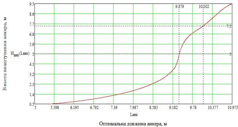
Рис. 2. Залежність оптимальної довжини ґрунтового анкера від висоти його влаштування

Отже є всі необхідні дані для розрахунку кроку і кількості рядів ґрунтових анкерів, та відповідно довжини анкерів кожного ряду.