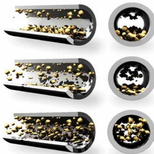
Рис. 2. Різні умови потоку Третій (найнижчий) варіант на малюнку представляє краді умови

Рівняння Дюран-Кондоль показує, що критична швидкість збільшується пропорційно квадратному кореню з діаметра трубопроводу для будь-якої заданої концентрації і розміру часток. Параметр швидкості F_L зазвичай не перевищує 1,5, навіть при об'ємній концентрації більше 15 відсотків.