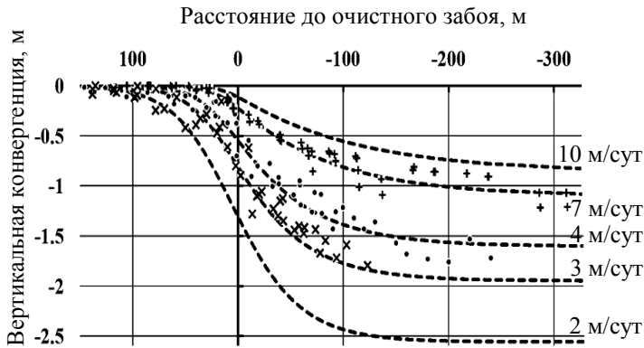
Рис. 2. Прогнозируемые значения вертикальной конвергенции выработки в условиях ш. «Стенная» при различных скоростях подвигания забоя и измеренные данные в 159-м (●), 163-м (×) и 165-м (+) штреках

По полученным параметрам построены графики прогнозируемых смещений (рис. 2).