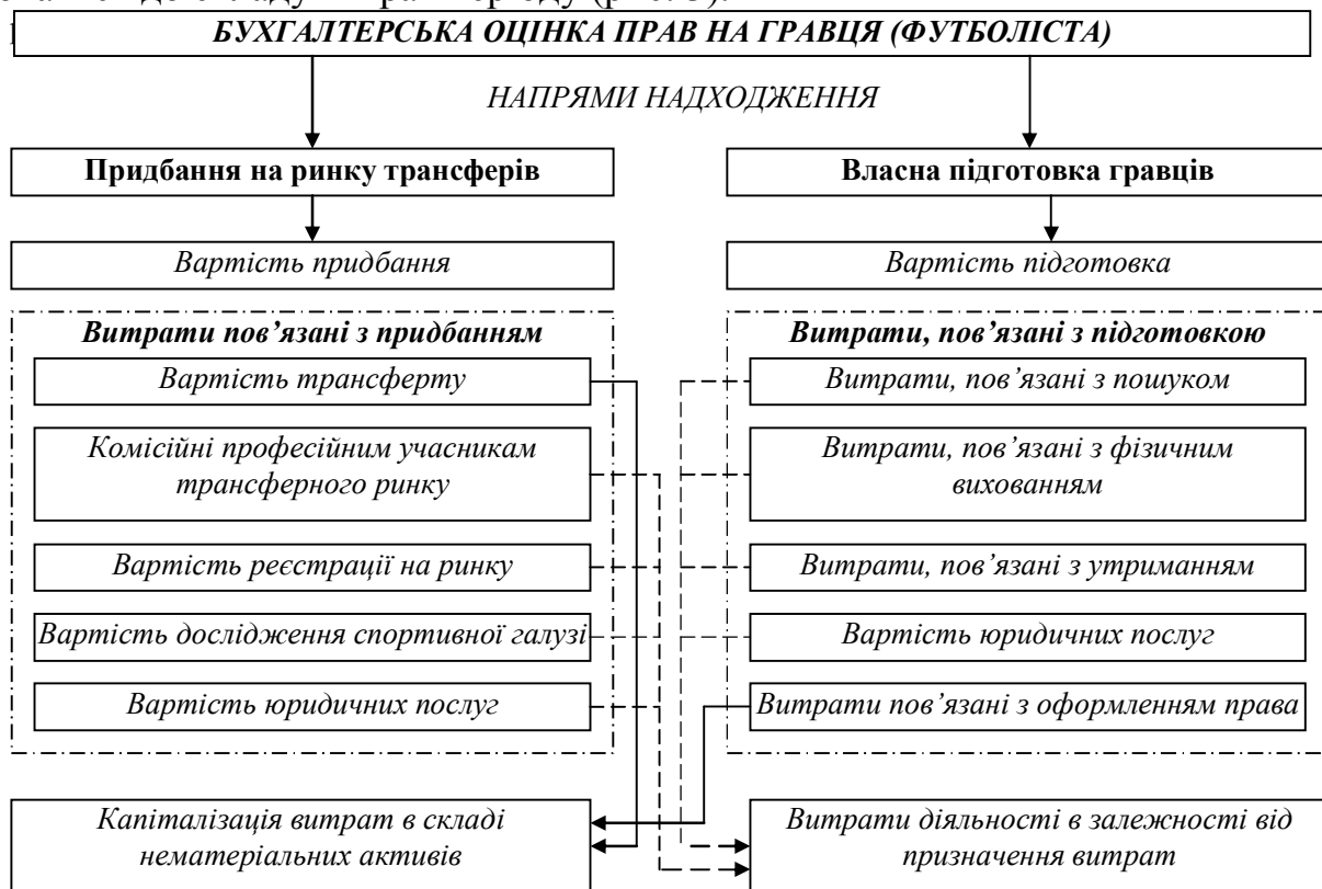
Рис. 3. Запропонований підхід до оцінки вартості права на гравця (футболіста)

ПФК, то капіталізація витрат на підготовку власного гравця не може мати місце, адже витрати, пов'язані з діяльністю, тобто підготовка команди її участь в різного роду змаганнях та інше, є основною діяльністю клубу як суб'єкта господарювання. Участь команди у відповідних змаганнях можна вважати етапом реалізації спортивної послуги (спортивне шоу), а не її виробництва. Виходячи з цього, витрати на підготовку команди та її утримання будуть виробничими витратами, виходячи з традиційного підходу до облікового відображення господарської діяльності підприємства. Капіталізувати витрати на підготовку гравця можна лише після підписання з ним контракту про співпрацю, відповідно до якого гравець зобов'язаний грати за команду ПФК певний період. В такому випадку можна капіталізувати витрати, пов'язані з його підготовкою за час від дати вступу в дію положень договору і до дати його включення до складу команди ПФК. Витрати, пов'язані з утриманням такого гравця як члена футбольної команди повинні включатися до складу витрат періоду (рис. 3).