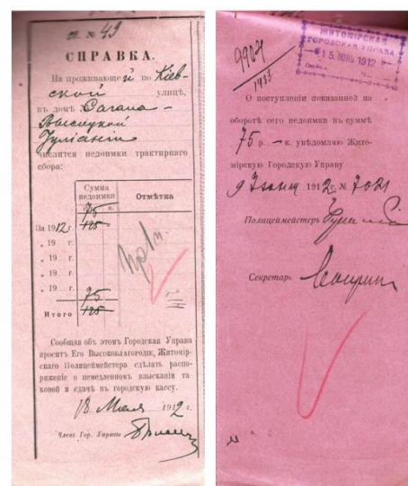
Рис. 2. Довідка про сплату трактирного збору Висоцької Юліані, власниці ресторану, розташованого у будинку Сегала [19]