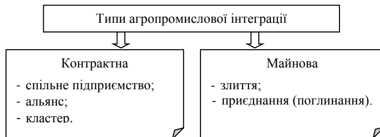
Рис. 1. Типологія інтеграції агропромислових підприємств

В економічній літературі розрізняють два типи інтеграції агропромислових підприємств: (1) на контрактній основі; (2) майнові (рис. 1). Перший тип передбачає взаємодію економічно самостійних організацій на паритетних засадах, закріплених господарським договором. Другий – взаємодію суб'єктів господарювання на засадах встановлення одноосібного права власності на декілька етапів виробничого процесу. Тобто компанія-інтегратор отримує у власність частину або усі активи інтегрованих агентів.