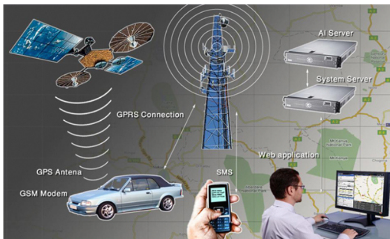
Рис. 2. Схема супутникової системи стеження за автомобілем

за допомогою програми моніторингу формує звіти, які надають максимально точну інформацію про експлуатацію транспортного засобу в заданий час: який водій, на якому відрізку дороги, з якою швидкістю керував даним автомобілем, де було перевищення швидкості або відхилення від маршруту.