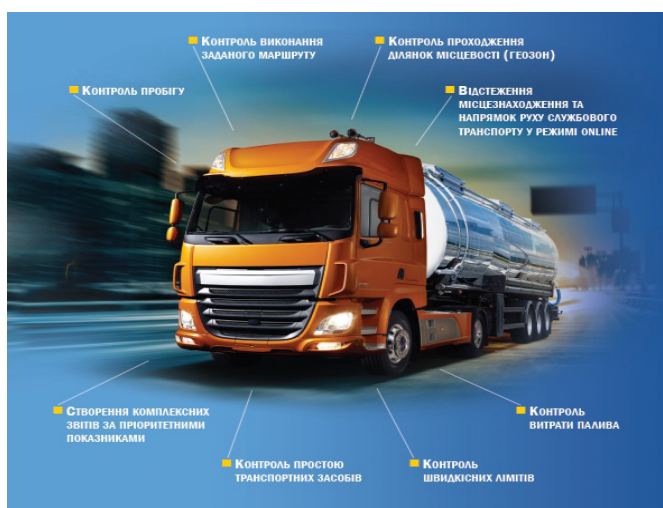
Рис. 1. Групи моніторингу роботи комерційних автомобілів в умовах ІТС

Інформація з GPS-трекера в машині передається на сервер (при цьому не потрібне встановлення додаткового програмного забезпечення на комп'ютер користувача), за допомогою якого відображається місцезнаходження транспортного засобу на карті, тривожні події, що вимагають негайного реагування (аварія, спроба викрадення, відключення акумулятора тощо). У салоні автомобіля розташована тривожна кнопка SOS, за допомогою якої водій може повідомити про виникнення екстреної ситуації. GPS-трекер