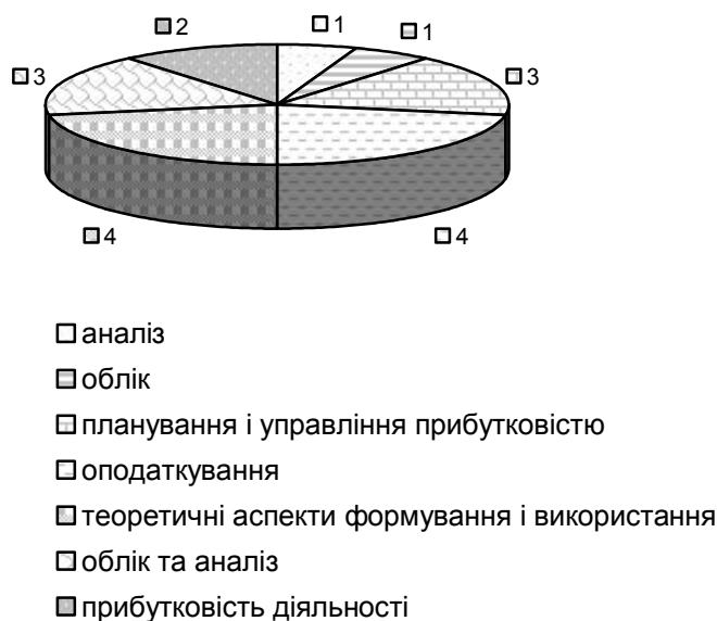
Рис. 2. Розподіл українських дисертацій на здобуття наукового ступеня кандидата економічних наук за період з 2000 по 2010 рр. за сферами наукової проблематики, пов'язаної з питаннями прибутку

На рис. 2. зображено проблематику дисертацій вітчизняних науковців, аналізуючи яку можна побачити, що українські дисертації на здобуття наукового ступеня кандидата економічних наук за період з 2000 по 2010 рр. присвячені проблемним питанням аналізу, обліку, обліку та аналізу прибутку, планування і управління прибутковістю, оподаткування прибутку, прибутковості діяльності, теоретичних аспектів формування прибутку. Так, в п'яти дисертаціях з досліджених увагу присвячено проблемним питанням оподаткування, в трьох – розглядалися питання теоретичних аспектів формування прибутку, обліку та аналізу прибутку, а також планування і управління прибутковістю, в двох – проблеми прибутковості діяльності, по одній – облік, аналіз прибутку.