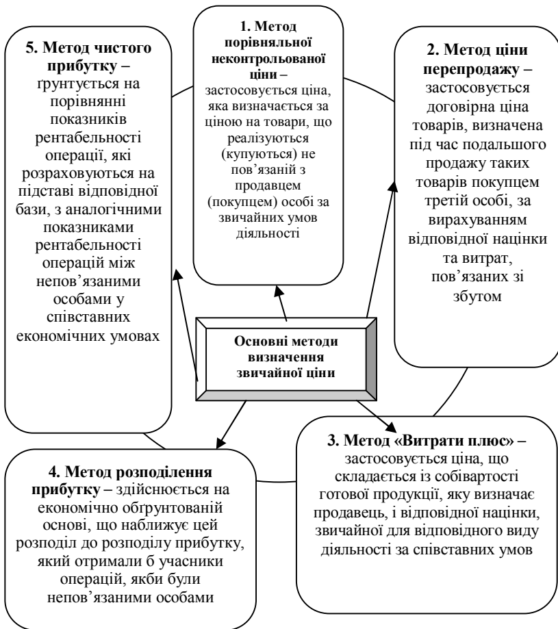
Рис. 1. Методи визначення звичайної ціни та характеристика їх застосування