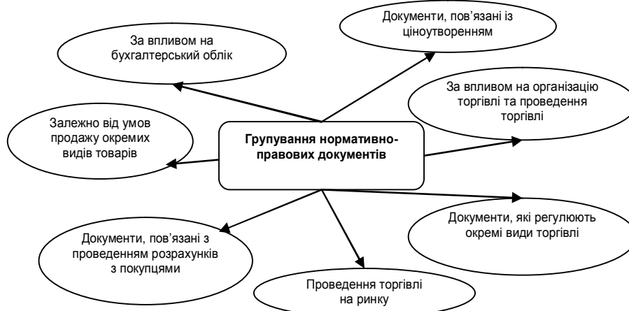
Рис 1. Групування нормативно-правових документів, які стосуються торговельної діяльності

Вважаємо, що нормативно-правові документи за відношенням до торговельної діяльності можна групувати за наступними ознаками (рис. 1).