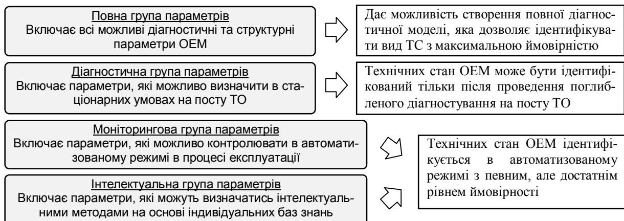
Рис. 2. Групи діагностичних параметрів об'єкта експлуатаційного моніторингу

Отже розподіл автомобіля на OEM нижчих рівнів повинен супроводжуватись аналізом кожної групи параметрів, характерних для даного OEM (рис. 2).