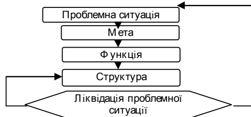
Рис. 2. Етапність конструювання системи за конструктивного підходу

Метою є стан, до якого направлена тенденція руху об'єкта. Мета зазвичай виникає з проблемної ситуації, яка не може бути дозволена коштами, які є в наявності. Система є засобом вирішення проблеми. Схематично зобразимо даний процес на рисунку 2.