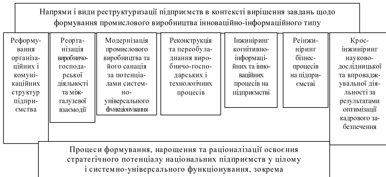
Рис. 1. Взаємозалежність і взаємозв'язок ключових напрямів реструктуризації за ключовими об'єктами докладання зусиль

Зазначене сприятиме пошуку і розробці ефективних проєктів, а також добору дієвих власників суб'єктів господарювання, здатних внести реальний капітал у модернізацію виробництва на інноваційній основі. При цьому запровадження у практику формалізованої ССУ рп дозволить не лише зорієнтувати модернізаційну діяльність виробничо-економічних систем на задоволення потреб ринку, а й узгодити інтереси суб'єктів управління різного рівня. І, останнє, що слід підтвердити: запровадження удосконаленого типу ССУ рп об'єднає в одне ціле результати діяльності і витрати на провадження трансформаційних змін, забезпечуючи процеси реструктуризації відповідним обсягом наявного стратегічного потенціалу (СП) підприємства з розмежуванням і перерозподілом за потребою факторних, матеріальних та глобальних потенціалів і, відповідно, потенціалів системно-універсального функціонування [8].