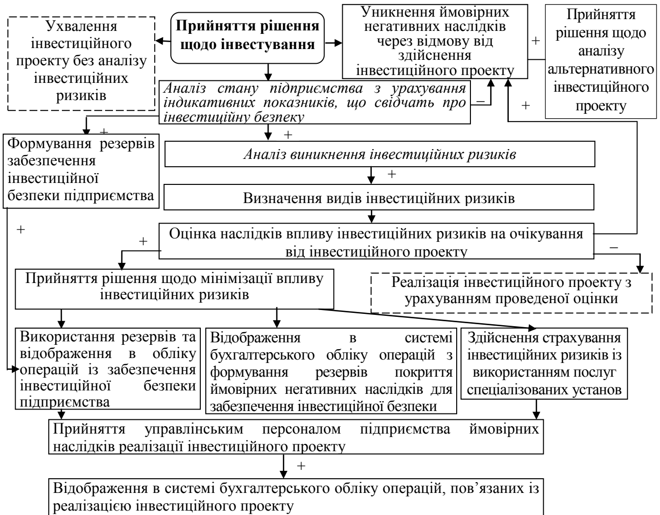
Рис. 2. Порядок управління ймовірними наслідками реалізації інвестиційних проектів, які здійснюються в умовах інвестиційного ризику в бухгалтерському обліку

Суть запропонованого порядку полягає в оцінці альтернативних варіантів реалізації рішення щодо інвестування. Визначаючи можливість прийняття рішення про залучення інвестиційних ресурсів керівництво підприємства розглядає три можливі варіанти, зокрема: 1) обґрунтування потреби в інвестиціях без аналізу інвестиційних ризиків; 2) відмова від реалізації проекту щодо залучення інвестицій; 3) прийняття рішення про реалізацію інвестиційного проекту з урахуванням показників, що характеризують інвестиційну безпеку підприємства. При оцінці стану інвестиційної безпеки оцінюються наслідки впливу інвестиційних ризиків та приймається рішення щодо мінімізації їх впливу, які відображаються в системі бухгалтерського обліку.