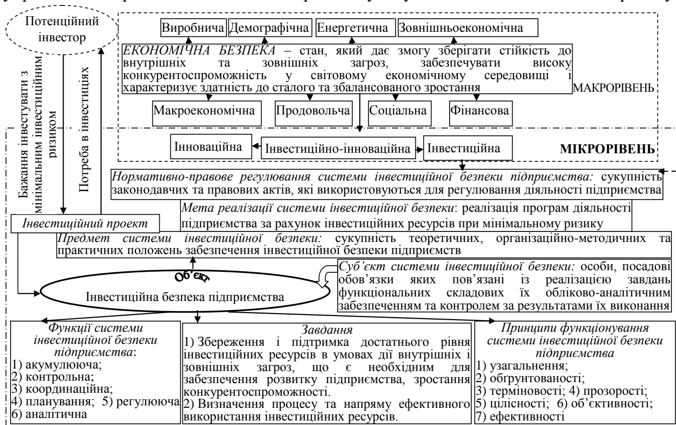
Рис. 1. Складові економічної безпеки та місце інвестиційної безпеки підприємства у її складі

Існування недостатньої уваги вчених до визначення місця інвестиційної безпеки підприємства в складі економічної безпеки зумовлює неефективність у прийнятті рішень у сфері інвестування через недооцінку потенційних вигід та загроз. З метою вирішення даного проблемного питання у складі економічної безпеки виділено інвестиційну складову. На рис. 1 представлено елементи інвестиційної безпеки підприємства (суб'єкт, об'єкт, завдання, функції, принципи, мета, нормативно-правове регулювання) та обґрунтовано їх змістовне наповнення, що забезпечило ефективну організацію, реалізацію та визначення місця операцій із забезпечення інвестиційної безпеки серед об'єктів бухгалтерського обліку з метою прийняття управлінських рішень для мінімізації ризиків усіх учасників інвестиційного процесу.