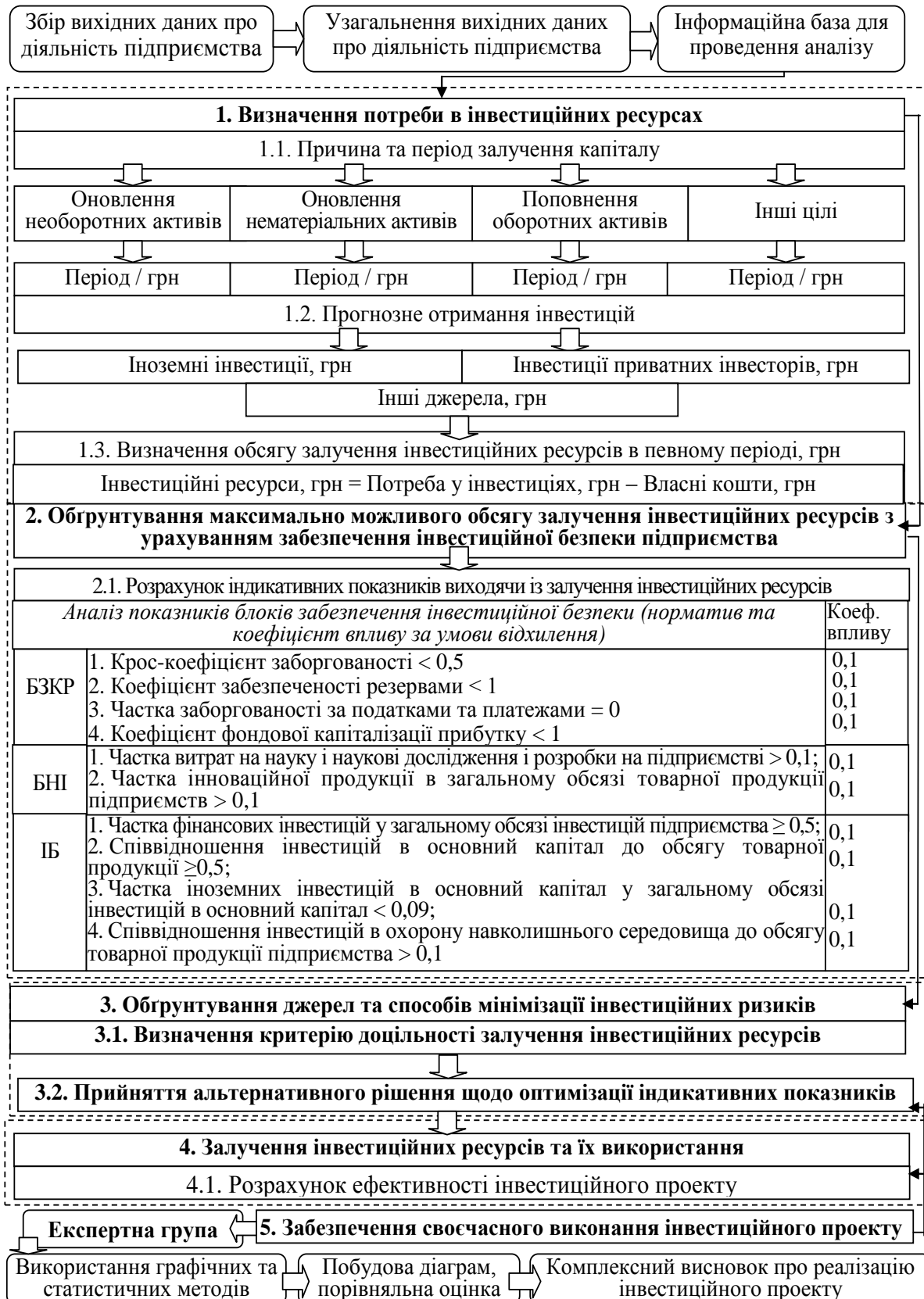
Рис. 4. Комплексна модель аналітичного обґрунтування доцільності реалізації інвестиційного проекту в умовах забезпечення інвестиційної безпеки підприємства