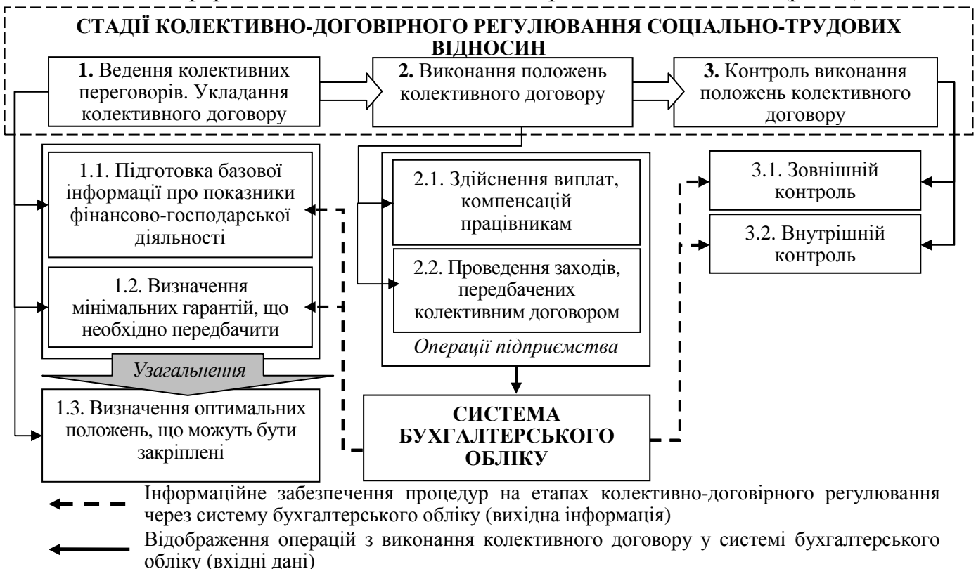
Рис. 2. Комплексне облікове забезпечення процесу колективно-договірному регулювання

Широкий спектр операцій, які підприємство здійснює для виконання положень колективного договору, обумовлює необхідність їх організаційного забезпечення на всіх стадіях колективно-договірному процесу. В цьому контексті розглядалися функції та повноваження бухгалтера, оскільки процес укладення і дії колективного договору потребує: 1) моніторингу його положень з точки зору відповідності чинному законодавству; 2) їх економічного обґрунтування; 3) оперативного, повного та детального інформаційного забезпечення контролю на всіх стадіях (рис. 2).