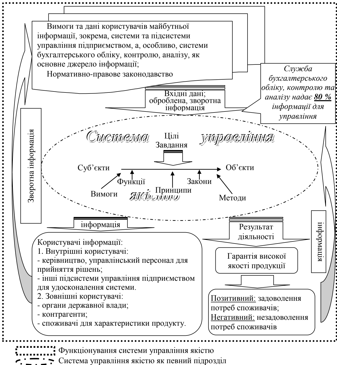
Рис. 1. Модель облікового забезпечення системи управління якістю

функціонального призначення інформаційних зв'язків, які інтегрують систему бухгалтерського обліку в СУЯ (рис. 1).