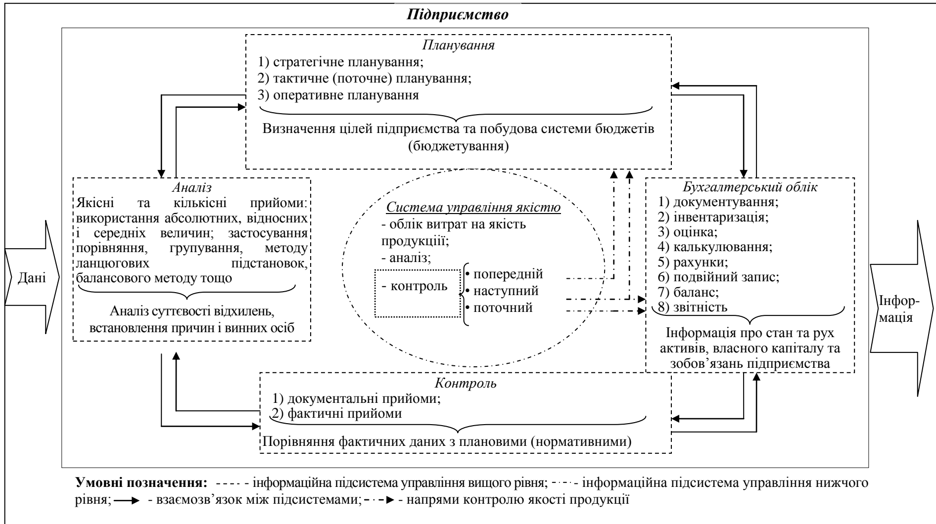
Рис. 3. Місце контролю якості продукції в інформаційній системі управління