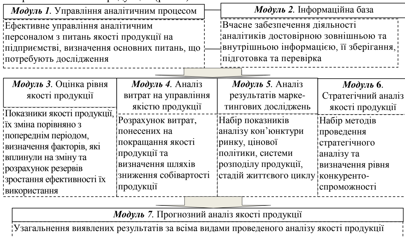
Рис. 5. Запропонована модульна структура системи комп'ютеризації економічного аналізу якості продукції

У результаті розвитку конкурентного середовища суб'єкти господарювання потребують такої інформації, що дозволить здійснити професійну оцінку господарської діяльності з метою вибору оптимальних методів управління підприємством. Так, у сфері економічного аналізу існує значна кількість програмних продуктів, кожен з яких має особливості та функціональні можливості, але в цілому вони застосовуються для вирішення завдань планування, прогнозування й економічного аналізу з метою розробки та підвищення обґрунтованості ухвалених управлінських рішень. Не зважаючи на відсутність в програмних продуктах блоку, призначеного для економічного аналізу якості продукції, пропонуємо його впровадити у програмному продукті "Галактика", в якому є модуль "Управління якістю продукції" (рис. 5).