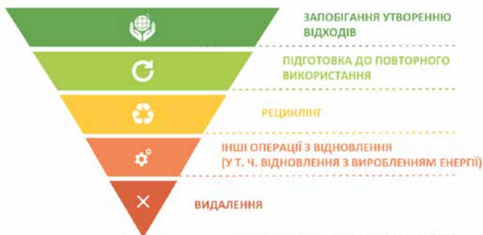
Рис. 1. Ієрархія управління відходами