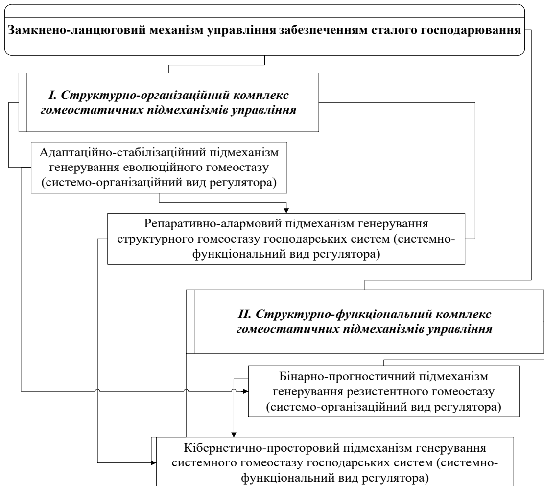
Рис. 1. Багаторівнева схема формування, перерформатування та реалізації дії замкнено-ланцюгового механізму управління забезпеченням сталого господарювання (авторська розробка)

Фактично ж, на першому етапі структурно-організаційного управління формується та запроваджується адаптаційно-стабілізаційний підмеханізм генерування еволюційного гомеостазу (системо-організаційний вид регулятора), який на наступному етапі інкорпорується до репаративно-алармового підмеханізму генерування структурного гомеостазу господарських систем (системно-функціональний вид регулятора). Таким чином, досягнення структурного гомеостазу передбачає еволюційність трансформації і перебудови внутрішнього середовища господарських систем.