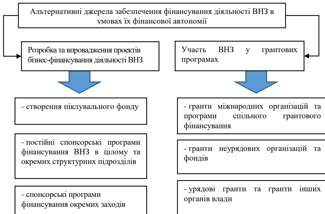
Рис. 1. Альтернативні джерела забезпечення фінансування діяльності ВНЗ в умовах їх фінансової автономії

Цьому сприяє фінансова автономія вищих навчальних закладів, яка розширює межі альтернативних джерел забезпечення фінансування діяльності вищих навчальних закладів (рис. 1).