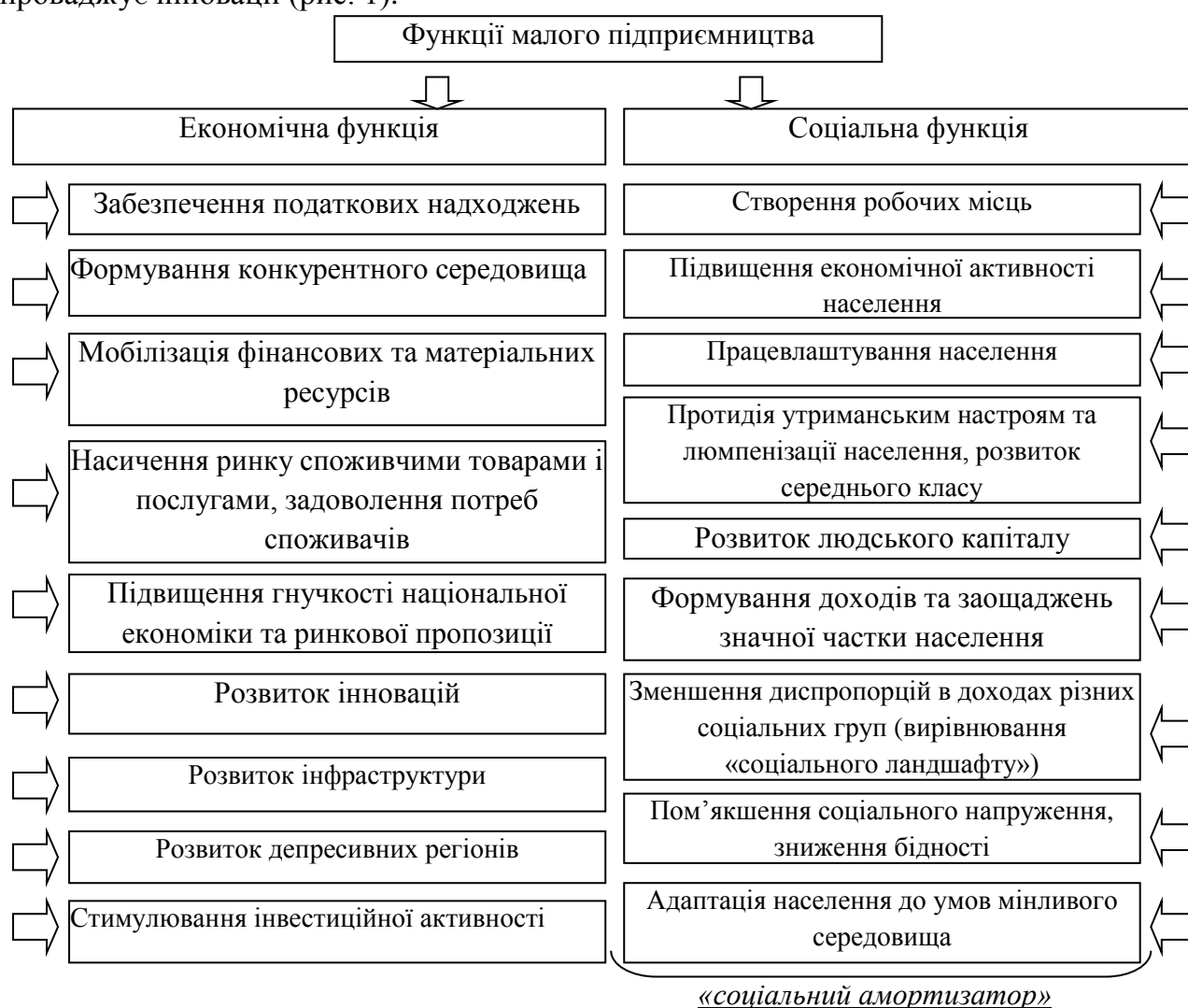
Рис. 1. Функції малого підприємництва

Роль і місце малого підприємництва (МП) найкраще проявляється в притаманних йому функціях. Звичайно, первинною функцією МП є економічна. Адже МП формує цивілізоване конкурентне середовище, сприяє демонополізації національної економіки, забезпечує мобілізацію та використання виробничих ресурсів, створює значну частку доданої вартості та національного доходу, впроваджує інновації (рис. 1).