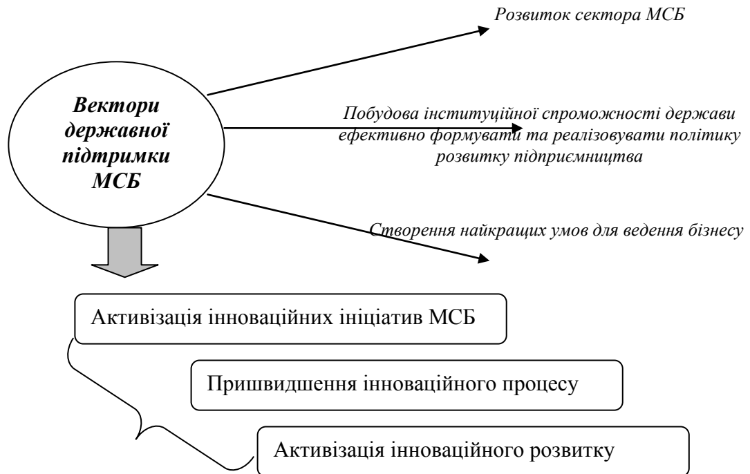
Рис. 2. Вектори державної підтримки інноваційних ініціатив МСБ*