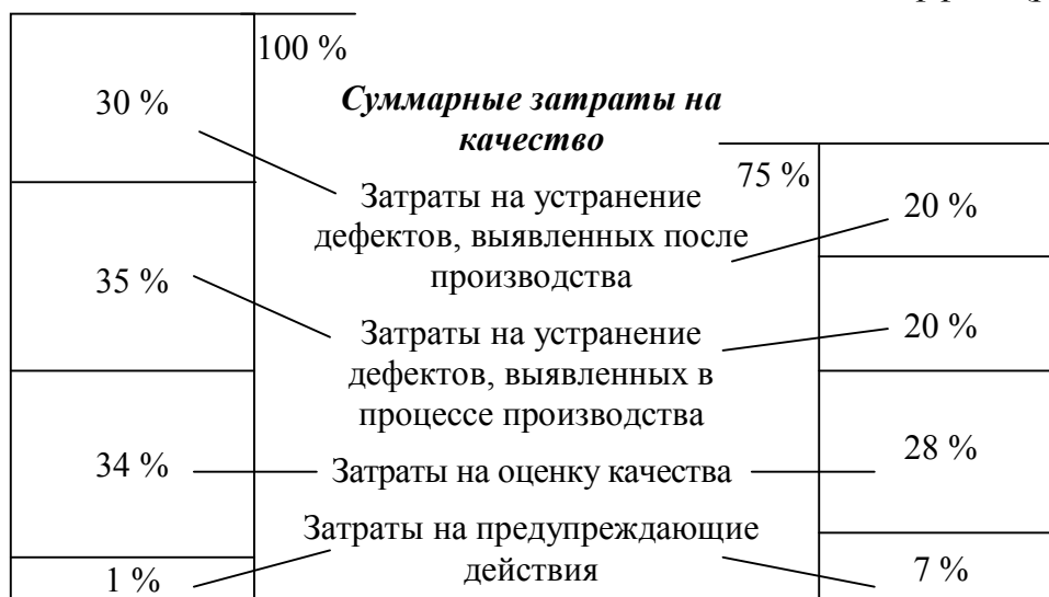
Рис. 3. Уровень затрат на качество до и после построения системы качества

В масштабах крупного винодельческого предприятия внедрение системы управления качеством может дать значительный экономический эффект (рис. 3).