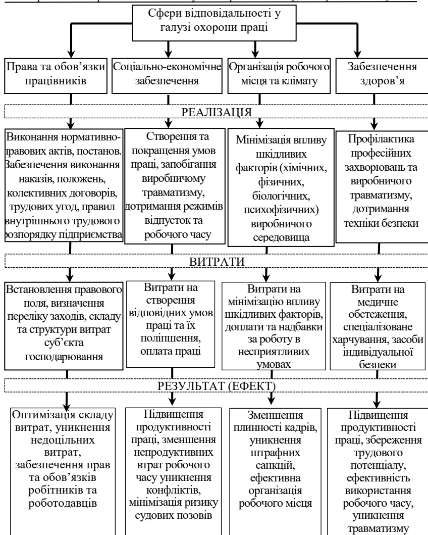
Рис. 1. Сфери відповідальності суб'єктів господарювання щодо охорони праці

Міжнародні нормативно-правові акти, нормативно-правові акти України, трудова угода, колективний договір та внутрішні нормативні акти підприємства визначають перелік заходів суб'єктів господарювання щодо охорони праці і, відповідно, визначають склад