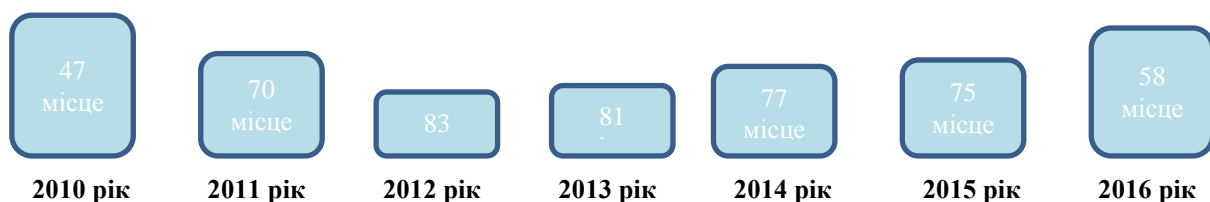
Рис.2. Під-індекс «Результати творчої діяльності»: динаміка зміни позиції України у Глобальному інноваційному індексі за 2010-2016 роки

Детальний розгляд локальних показників представлених під-індексів дозволяє констатувати наступне: