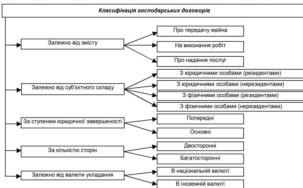
Рис. 2. Узагальнена класифікація господарських договорів для потреб бухгалтерського обліку

Також, зауважимо, що такі класифікаційні ознаки, як залежно від наявності у сторін прав та обов'язків та за суб'єктами для потреб бухгалтерського обліку дозволять лише збільшити розрізи аналітики, що забезпечить покращання контролю за виконанням договорів. Вважаємо, що наведена класифікація господарських договорів є доцільною для застосування у бухгалтерському обліку, проте на підставі проведеного аналізу літературних джерел пропонуємо доповнити її наступними ознаками: залежно від суб'єктного складу, за ступенем юридичної завершеності, залежно від валюти укладання (рис. 2).