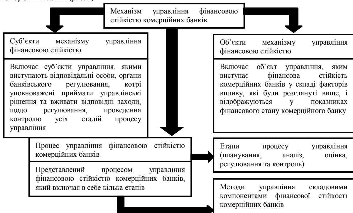
Рис.1. Складові механізму управління фінансовою стійкістю (розроблено автором)

Основна проблема стійкості комерційних банків пов'язана з нестабільною економікою України, яка робить тільки перші кроки у напрямі відкритого суспільства з метою знайти своє місце у світогосподарських відносинах. Ця проблема визначається насамперед стабільністю економічного середовища, яке оточує комерційний банк. В сучасних умовах проблема банкрутства є досить актуальною, зважаючи на її банкоцентричність та вплив політично-економічних подій 2014-2015 рр. Досить важливою є розробка спеціальних методик для виявлення та попередження небезпеки банкрутства. Тому вчені виділяють три блоки, які включає механізм управління фінансовою стійкістю комерційних банків (рис. 1).