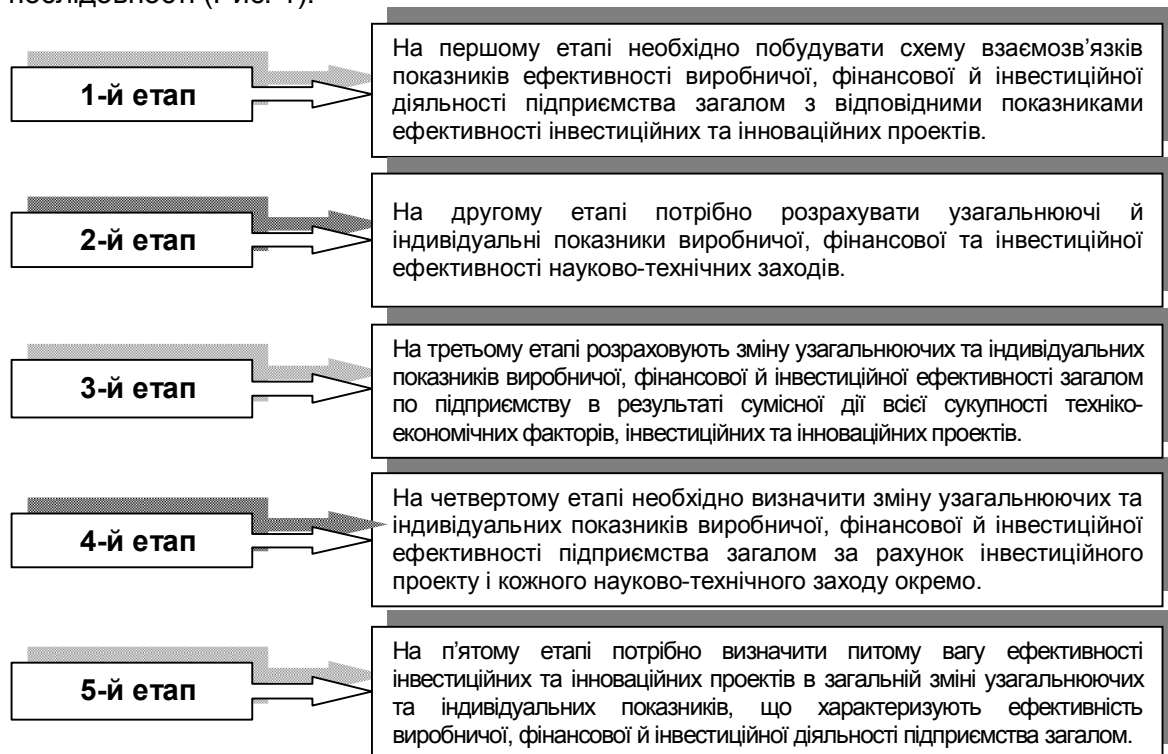
Рис. 1 Аналіз впливу інвестиційно-інноваційних проектів, що характеризують ефективність виробничої, фінансової й інвестиційної діяльності підприємства

Аналіз впливу інвестиційно-інноваційних проектів на зміну узагальнюючих та індивідуальних показників, що характеризують ефективність виробничої, фінансової й інвестиційної діяльності підприємства, доцільно проводити в наступній послідовності (Рис. 1):