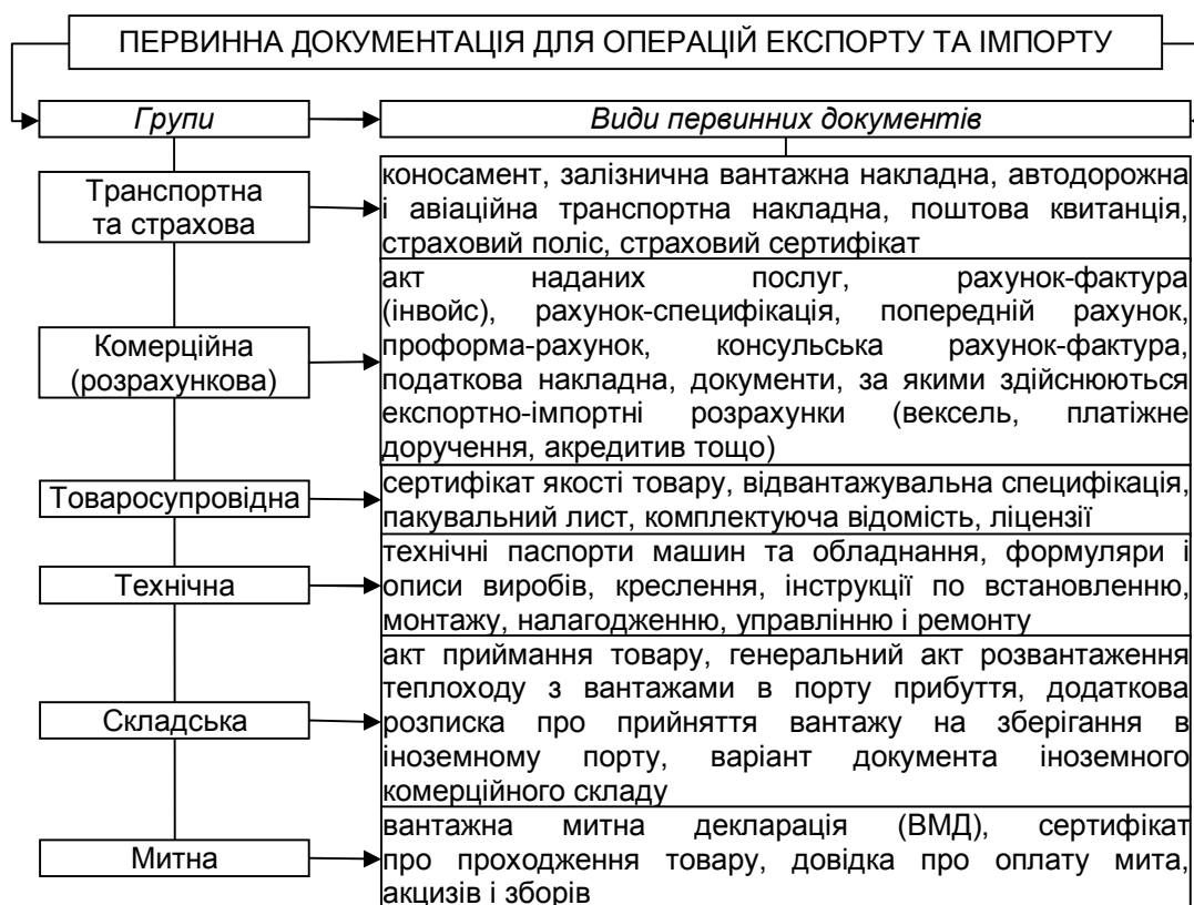
Рис. 2. Первинні документи для оформлення операцій експорту та імпорту

Отже, на підставі вищенаведеної інформації систематизовано види первинних документів та представлено перелік документації у зовнішньоекономічній діяльності, що забезпечить оперативність дій бухгалтерської служби під час документального оформлення господарських операцій (рис. 2).