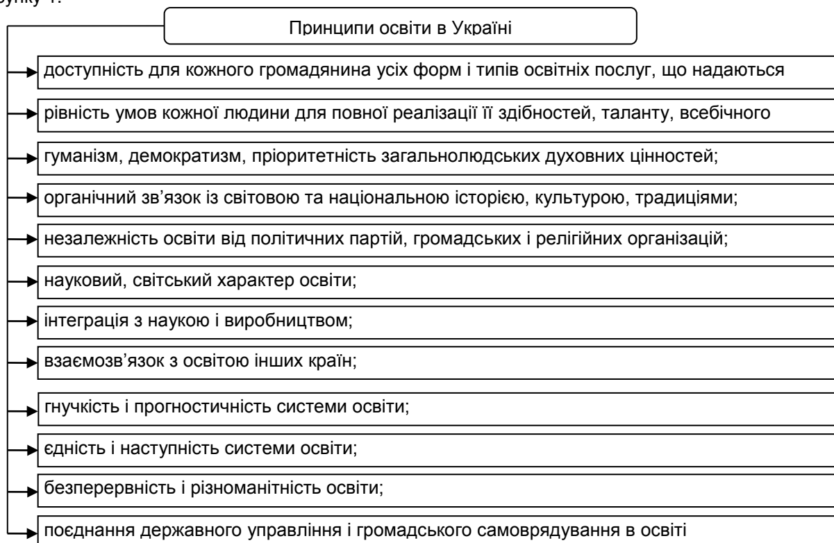
Рис. 1. Основні принципи освіти в Україні

Основними принципами освіти в Україні, відповідно до Закон України «Про освіту» наведено на рисунку 1.