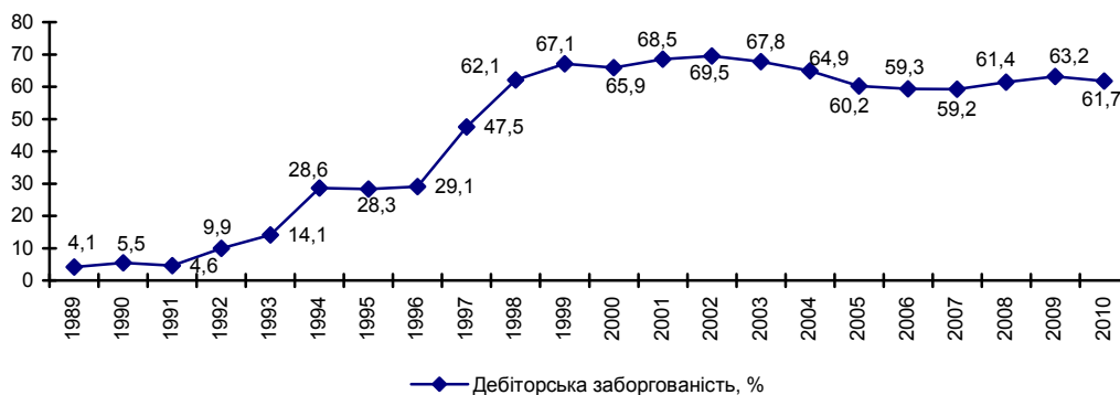
Рис. 1. Частка дебіторської заборгованості у складі оборотних активів підприємств України

зокрема, в 2010 році дебіторська заборгованість склала 1374810,4 млн. грн. [4, С. 82], що становить 61,7% обсягу оборотних активів підприємств (рис. 1). Це вказує на дефіцит оборотних активів вітчизняних підприємств, що спричинено зменшенням їх найліквіднішої складової та можливості залучення позикових ресурсів, що погіршує фінансовий стан підприємств.