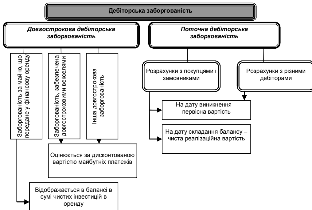
Рис. 3. Оцінка дебіторської заборгованості

нараховуються відсотки, оцінюється та відображається в Балансі за її теперішньої вартістю, тобто дисконтовану сумою майбутніх платежів (за вирахуванням суми очікуваного відшкодування), яка, як очікується, буде отримана для погашення цієї заборгованості. Визначення теперішньої вартості залежить від виду заборгованості та умов її погашення.