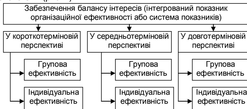
Рис. 2. Ієрархічна схема визначення ефективності підприємства

Враховуючи досліджені аспекти цієї категорії, виявлені проблеми та застосовуючи класифікацію, можна створити наступну ієрархічну схему, яка буде покладена в основу побудови цілісної концепції ефективності соціально-економічної системи (рис. 2).