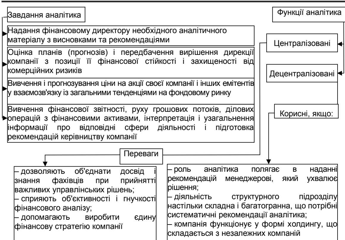
Рис. 4. Завдання і функції аналітика (розроблено на основі [2, с. 78-79])

Аналізуючи дані рис. 4 підтвердимо, вагомість професійного розвитку аналітика, адже саме від знання методики аналізу всіх напрямів господарської діяльності підприємства та від вміння визначити, правильно розрахувати та інтерпретувати необхідні коефіцієнти, залежить управління об'єктами аналізу відповідного напрямку, яке на основі даних аналітика здійснює фінансовий директор. Тому, аналітик повинен не лише вміти здійснювати шаблонні розрахунки, але й чітко розуміти їх значення для господарської діяльності підприємства.