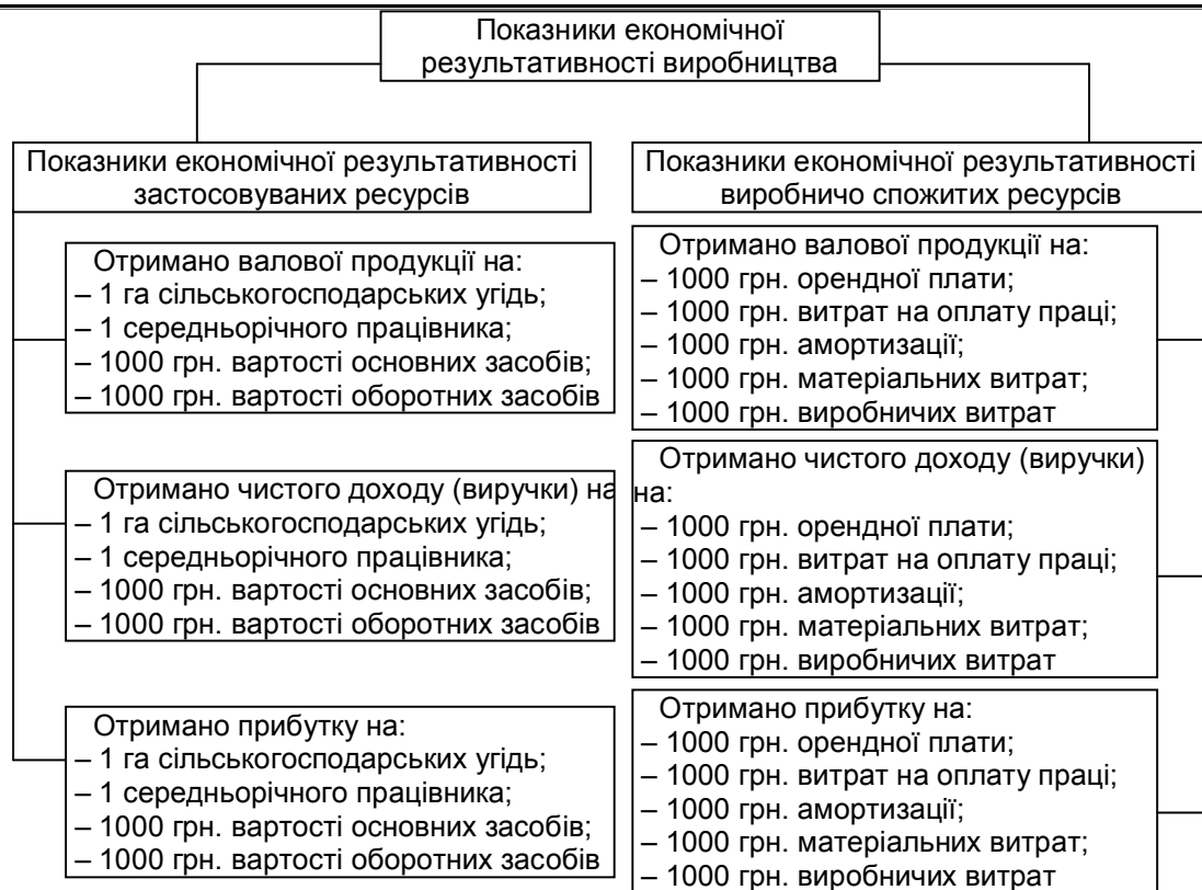
Рис. 2. Система показників економічної результативності виробництва