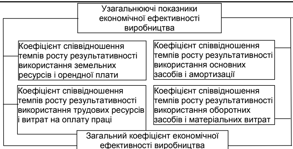
Рис. 4. Система узагальнюючих показників економічної ефективності виробництва