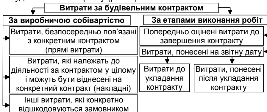
Рис. 2. Класифікація витрат за будівельним контрактом за різними ознаками [1, с. 381]

Для визнання доходів і витрат важливо розглянути витрати за періодами виконання будівельного контракту (рис. 2).