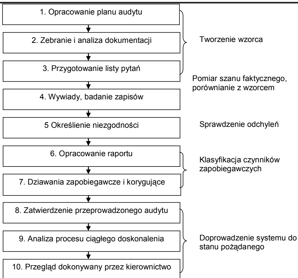
Rys. 1. Metodyka prowadzenia audytu

Głównym zadaniem audytu operacyjnego jest usprawnienie działania jednostki. Aby ten cel osiągnąć należy stosować zalecenia audytu.