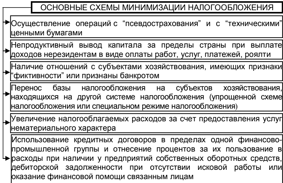
Рис. 2. Основные схемы минимизации налогообложения прибыли организации

Как отмечает Н. Рубан [5], Государственной налоговой службой Украины разоблачены основные схемы минимизации налогообложения, которые подлежат жесткому контролю со стороны налоговых органов. Приведем примеры основных, раскрытых органами налогового контроля, схем минимизации налогообложения (рис. 2).