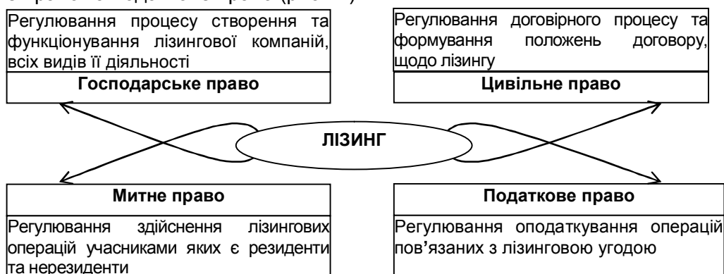
Рис. 1. Лізинг в системі галузей права

Таким чином, лізинг знаходиться на перетині різних галузей права, зважаючи на свою багатогранність. Кожна галузь, регулює відповідну сферу лізингу та напрям його прояву як економічного явища. Зважаючи на економічну природу лізингу, основними галузями права в системі яких містяться положення щодо лізингу, лізингових операцій, лізингових відносин є господарське право, цивільне право, митне право та податкове право (рис. 1.).