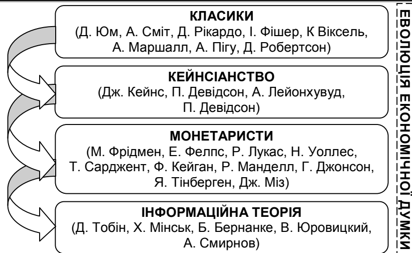
Рис. 1. Еволюція концепцій розвитку грошово-кредитної системи

Розвиток монетарної теорії пройшло ряд етапів, кожен з яких вніс значний вклад макроекономічну теорію 20-го століття. Довготривала еволюція теоретичних уявлень про роль грошей призвела до формування декількох концепцій, в основі яких лежить розроблена ще класиками кількісна теорія грошей (Д. Юм, А. Сміт, Д. Рікардо, І. Фішер, К. Віксель, А. Маршалл, А. Пігу, Д. Робертсон), яка розглядала вплив змін об'єкту грошової маси на сукупний випуск продукції. Кількісну теорію після змінила кейнсіанська (Дж. Кейнс, П. Девідсон, А. Лейонхувуд), яка з'явилася в 30-40-х роках двадцятого століття та швидко увійшла в практику як концепція реформування економічної політики. Далі на фоні інфляційних процесів в світовій економіці з'явилася монетаристська версія кількісної теорії (М. Фрідмен, Е. Фелпс, Р. Лукас, Н. Уоллес, Т. Сарджент, Ф. Кейган, Р. Манделл, Г. Джонсон, Я. Тінберген, Дж. Міз). Кризові явища в світовій економіці 1997-1998 рр. та в 2008 р. заставили змінити звичайні уявлення про гроші як засобу накопичення та обміну на носія певної інформації, яка має важливу управлінську силу. На цій основі з'явилася сучасна інформаційна теорія грошей (Д. Тобін, Х. Мінський, Б. Бернанке, В. Юровицький, А. Смирнов).