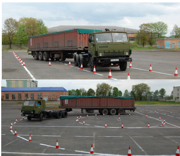
Рис. 2. Види випробувань автопоїзда-контейнеровоза для проведення досліджень його маневреності

При виконанні таких маневрів, як усталений рух по колу, “поворот на 90°”, “поворот на 180°”, “поворот на 270°”, “S-подібний поворот” тощо оціночним критерієм служитиме максимальна ширина габаритної смуги руху (ГСР). Під час випробувань “поворот на 180°” додатковим оціночним критерієм буде величина ширини коридору, необхідного для розвороту автопоїзда-контейнеровоза.