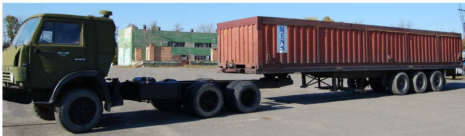
Рис. 1. Експериментальний автопоїзд-контейнеровоз