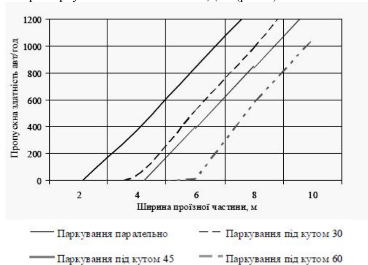
Рис. 2. Графік зміни пропускну здатності проїзної частини при зміні способу розстановки автомобілів при паркуванні

Для оцінки впливу вуличного паркування на пропускну здатність вулиці можна використати графік її зміни проїзної частини при паркуванні автомобілів на ВДМ (рис. 2).