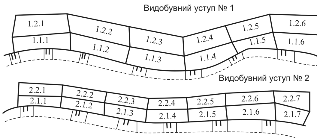
Рис. 2. Схема розбивання уступів на моноліти

Як критерій оптимальності моделі прийнято сумарне (з урахуванням значущості різних об'ємів блоків) відхилення фактичних об'ємів видобування блоків від запланованих у виробничій програмі.