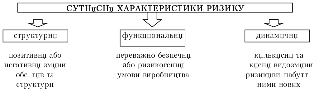
Рис. 1. Сутнісні характеристики ризику за І.Є. Калмиковою [1, С. 7]

недоотримання очікуваних фінансових результатів в умовах невизначеності умов функціонування підприємства. Проте І.Є. Калмикова вважає, що «наявність різноманітності визначень ризику в економічній літературі вказує на те, що дана економічна категорія не набула загальноприйнятих, стійких, логічних ознак» [1, С. 13] та запропонувала сутнісні характеристики ризику (рис. 1).