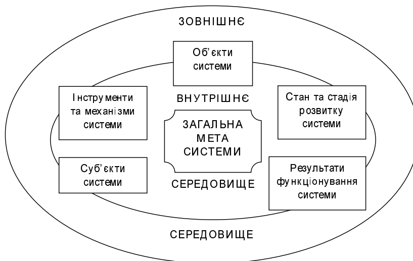
Рис. 1. Загальна схема модернізаційної системи

Розглянемо детальніше кожний елемент модернізаційної системи відповідно до запропонованої схеми.