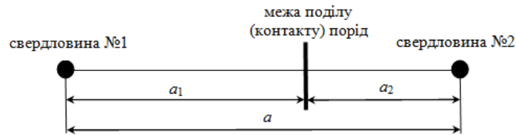
Рис. 2. Схема до розрахунку відстаней до межі поділу порід

при одночасному підриванні суміжних зарядів ВР (рис. 2).