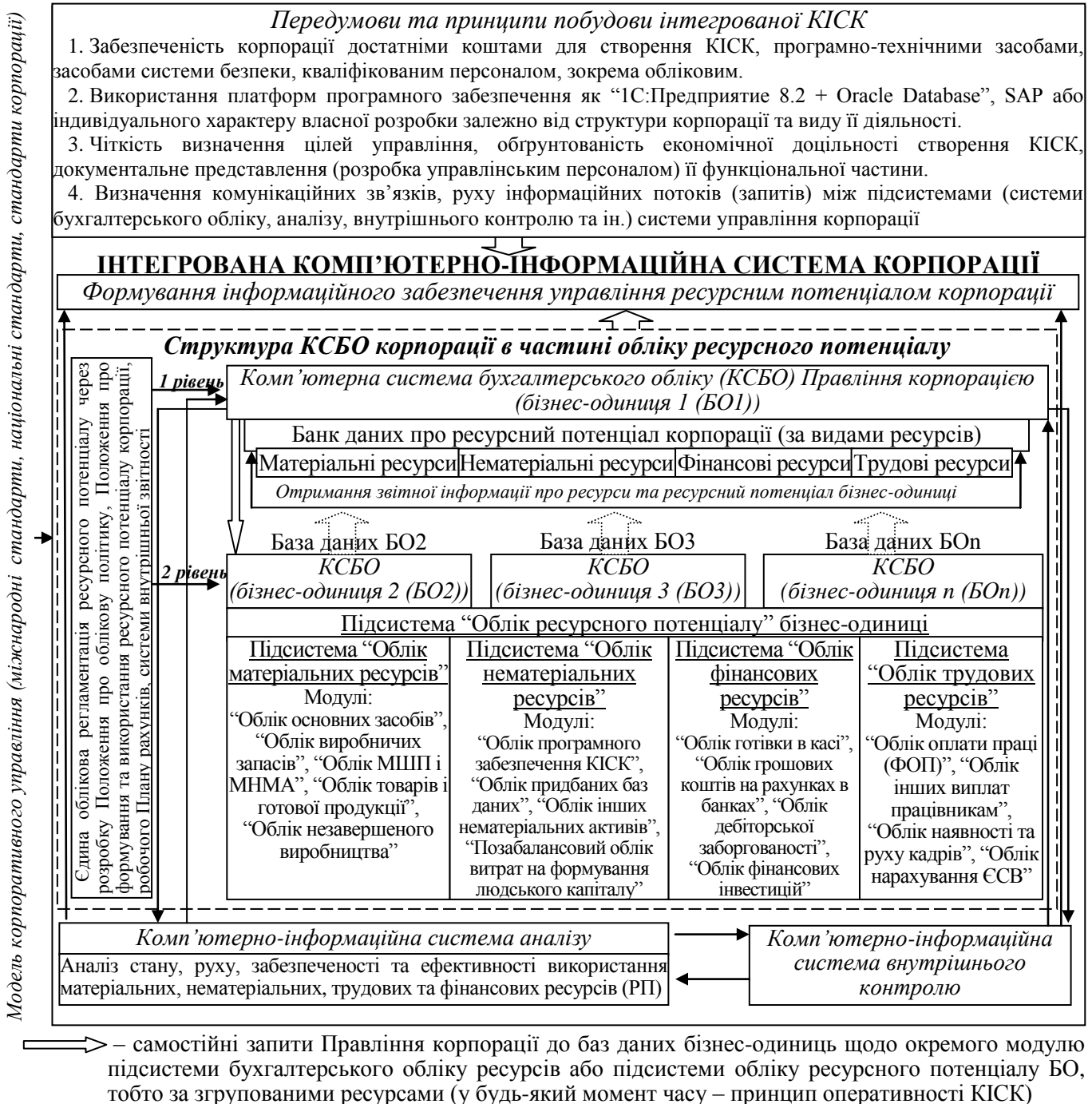
Рис. 3. Організаційна модель бухгалтерського обліку ресурсного потенціалу в умовах побудови інтегрованої комп'ютерної інформаційної системи корпорації

чином, в умовах інтегрованої КІСК досягається ефект максимальної деталізації інформації про ресурсний потенціалом корпорації, що сприяє підвищенню ефективності управління ресурсами об'єднання.