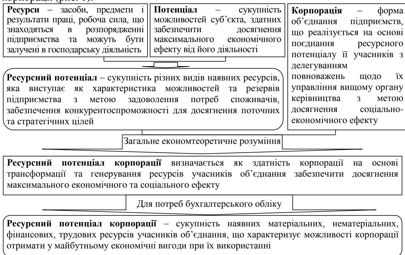
Рис. 1. Визначення економічної сутності поняття “ресурсний потенціал корпорації”

Дослідження сутності понять: “корпорація”, “ресурси”, “потенціал”, “ресурсний потенціал” та врахування особливостей корпорації як форми об'єднання підприємств дозволило сформуванню підходів до розуміння ресурсного потенціалу корпорації (рис. 1).